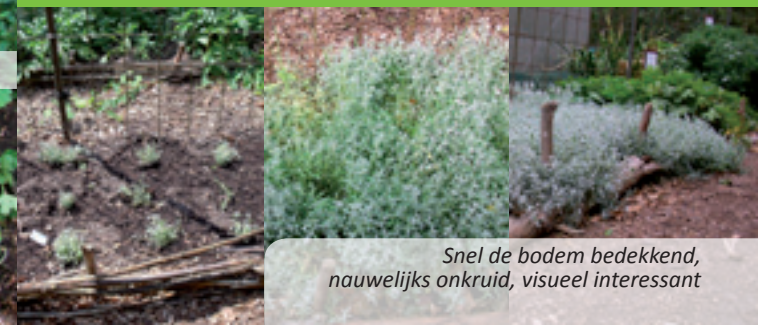
Snel de bodem bedekkend, nauwelijks onkruid, visueel interessant