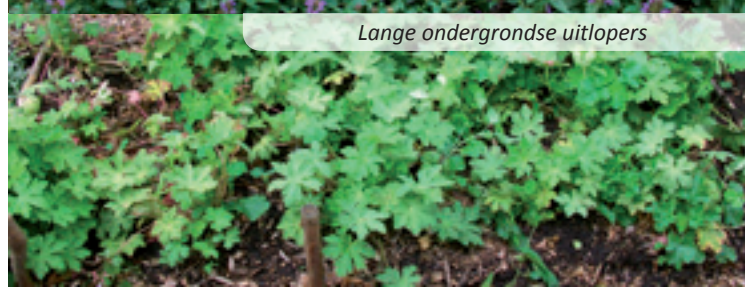
Lange ondergrondse uitlopers