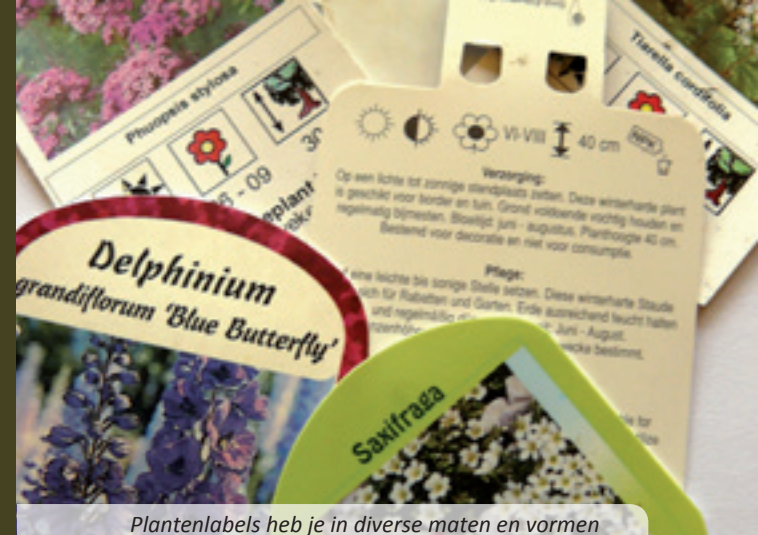
Plantenlabels heb je in diverse maten en vormen