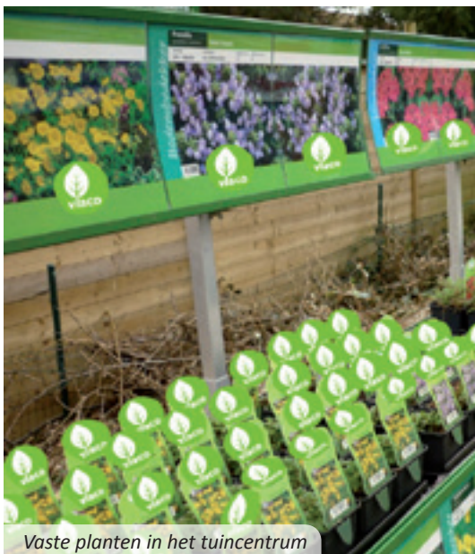
Vaste planten in het tuincentrum

In ieder tuincentrum, bij verschillende vasteplanten-keukerijen en in iedere tuin kunt u vaste planten vinden. Kiest u de vaste planten niet alleen op basis van bloei en bladkleur, maar houdt u ook rekening met hun grootte en specifieke eisen, dan zal u er lang plezier aan beleven.