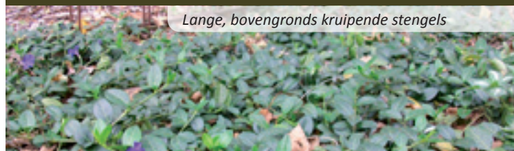
Lange, bovengronds kruipende stengels