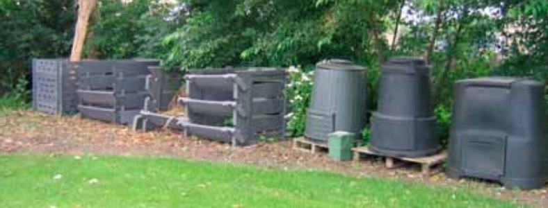
Compostvaten en compostbakken