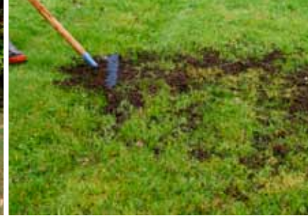
Compostgebruik in moes- en fruittuin, of op het gazon