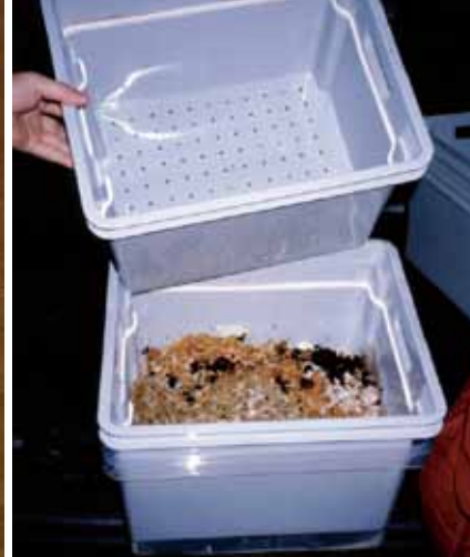
De 2 meest gebruikte wormenbaktypes (monobak en stapelbak) en de gaatjes in de geperforeerde bak