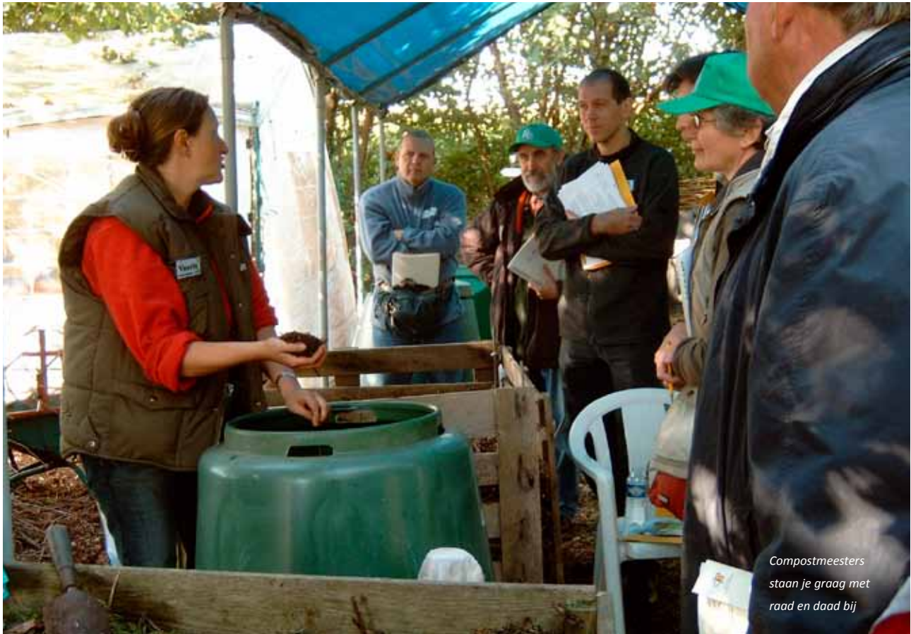
Compostmeesters staan je graag met raad en daad bij