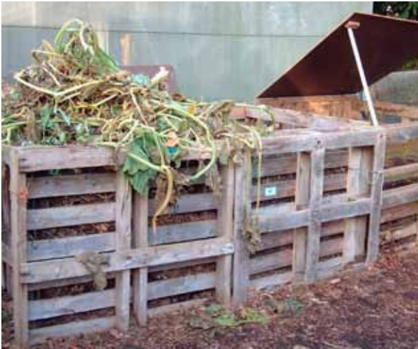
Drie compostbakken naast elkaar plaatsen, werkt het handigst

gens de ruimte en de hoeveelheid tuinresten die u verwacht. De hoeveelheid tuinresten is echter moeilijk in te schatten. In de loop van de maanden waarin u een compostbak vult, zorgt de vertering immers al voor een vermindering van het volume. In een compostbak van 1 m 3 kunt u een veelvoud daarvan aan groenresten verwerken.