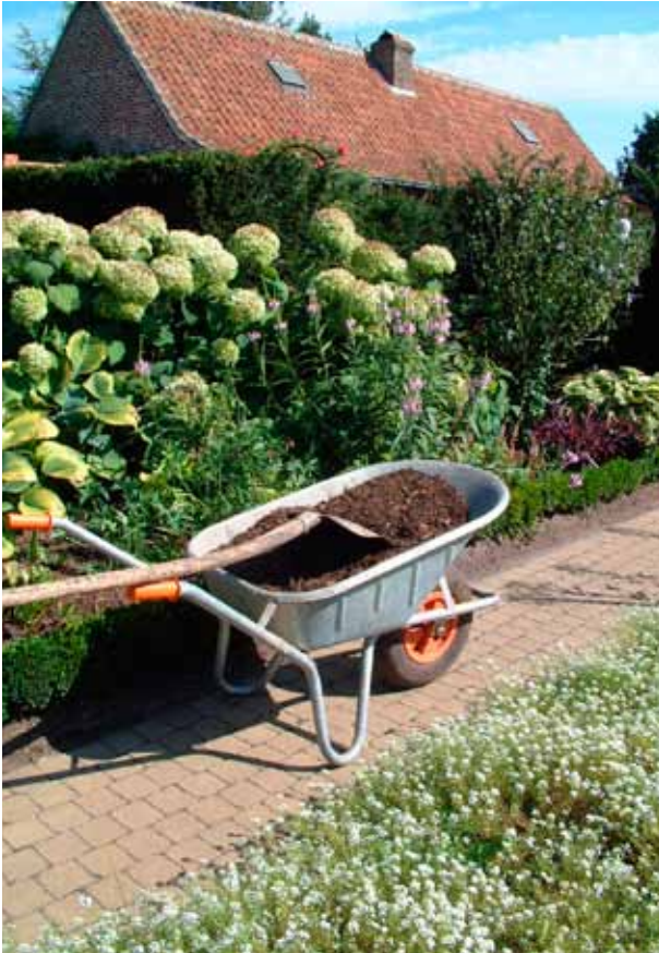
Compost, klaar voor gebruik in de tuin