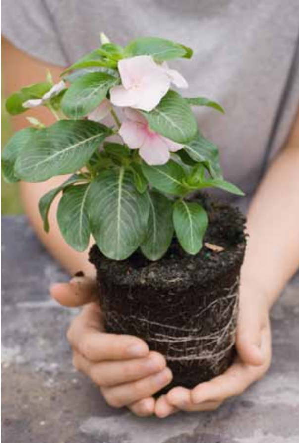
Compostgebruik in bloempotten en -bakken