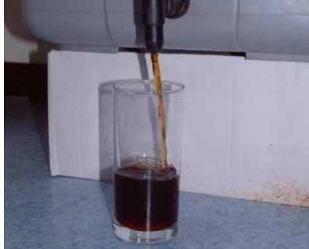
Percolaat uit de wormenbak

Omdat in de wormenbak de temperatuur amper boven de omgevingstemperatuur uit stijgt, verliezen zaden van bijvoorbeeld