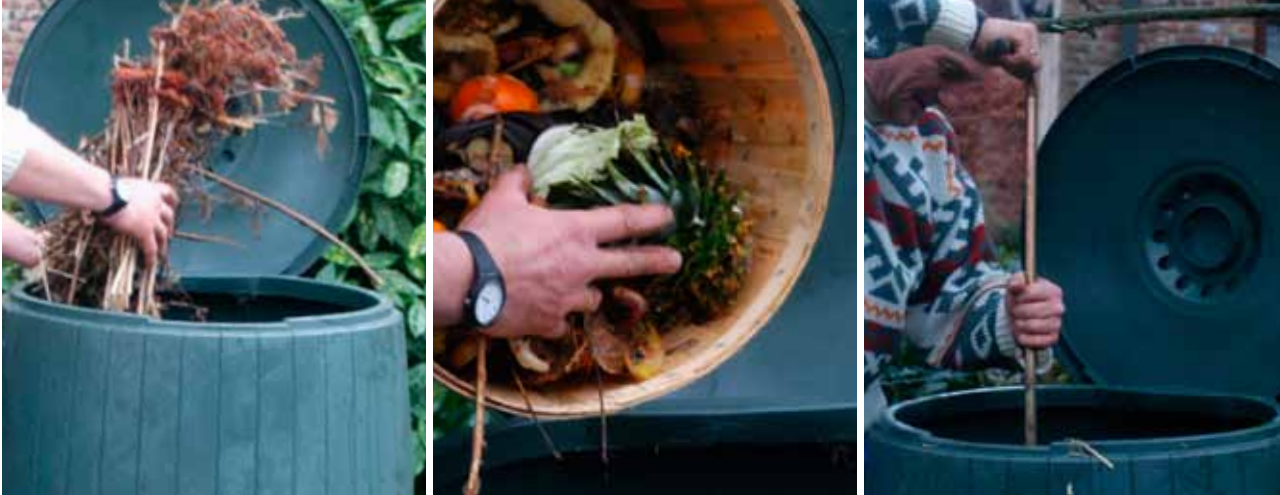
Het vullen van het compostvat: een ruwe beddinglaag, tuin- en keukenresten, beluchten

materiaal: houtsnippers, fijne takjes en dorre stengels van vaste planten. Dat verzekert gedurende de eerste maanden een vlotte instroom van lucht en voorkomt dat de luchtgaten verstopt raken.