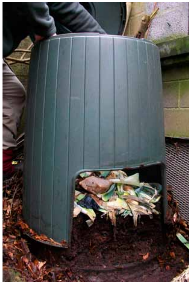
Compost oogsten? Til de romp van het vat over het gecomposteerde materiaal