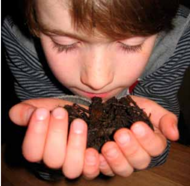
De kijk- en ruiktest