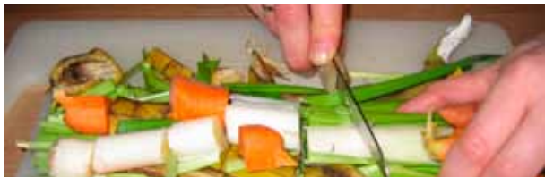
Wanneer u het ingangsmateriaal verkleint, verteert het sneller

Opgelet: In het laatste geval kan het ook zijn dat de wormen vluchten uit de verzuurde massa dieper in de bak, of dat het percolaatniveau erg hoog staat (zie verder). Graaf dus iets lager om dit na te gaan.