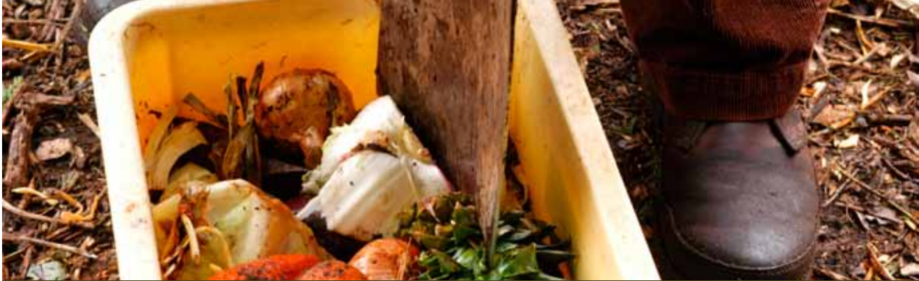
Verklein wat te grof of te lang is

ten voor de afbraakorganismen. Snoeihout en ander grof materiaal kunt u het best eerst versnipperen in een hakselaar of met een snoeischaar, en haagscheersel en lange, fijne stengels van klimplanten zelfs met een grasmaaier. Aardappelen of pompoenen kunt u in een emmer met een spade te lijf gaan.