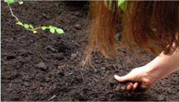
Mulchen met compost