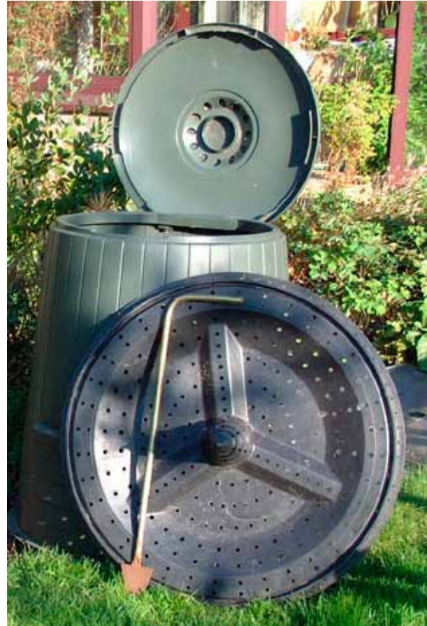
De onderdelen van het compostvat: bodemplaat, beluchtingstok, romp en deksel

Zorg ervoor dat de volledige bodemplaat op enkele stenen of tegels (bv. 7 of 9 stoeptegels) kan steunen zodat die plaat niet in de aarde zakt. Zorg er zeker voor dat ook het midden van de plaat degelijk wordt ondersteund, zoniet zal ze onvermijdelijk doorbuigen. De bodemplaat heeft een speciaal profiel en is van gaten voorzien om lucht in het vat te laten dringen. Die luchtstroom blijft slechts aan de gang als de plaat enkele cen-