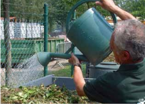
Breng de vochtigheid van het composterend materiaal op peil