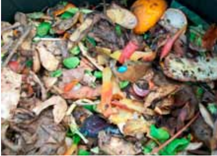
Een voorbeeld van 'groen' materiaal