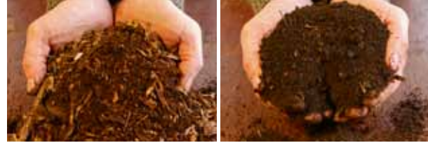
Het verschil tussen jonge compost (l) en rijpe compost (r)

en ruikt naar bosgrond. Sommige grondstoffen (vooral bruin materiaal) zijn nog wel te herkennen: notendoppen, stukjes snoeihout ... Deze compost is een stabiele humusgrond met langzaam werkende meststoffen, een onovertroffen bodemverbeteraar die het bodemleven stimuleert, het waterhoudend vermogen bevordert, ziekten voorkomt en de plant voedt.