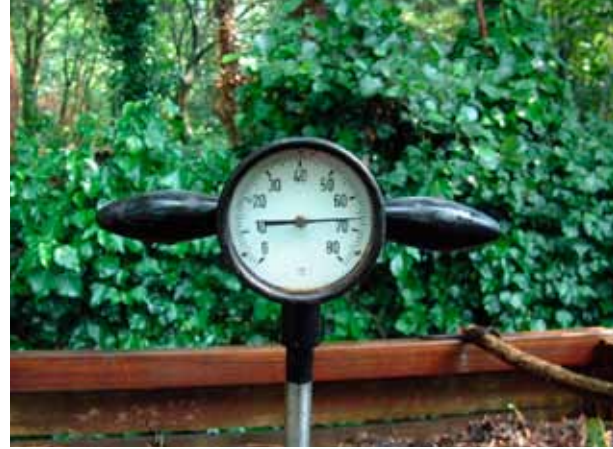
Tijdens het composteren kan de temperatuur aardig oplopen

Zijn alle voorwaarden (voedsel, vocht en lucht) vervuld, dan zetten de compostorganismen zich aan het werk. Verwerkt u grote hoeveelheden (meer dan een paar kruiwagens) organisch materiaal in één keer, dan neemt de temperatuur sterk toe. Temperaturen van 50 °C zijn courant en zelfs 60 °C en 70 °C zijn geen uitzondering. We noemen dit de broei. Tijdens de broei zijn uitsluitend micro-organismen (zoals schimmels en bacteriën) actief. Zij verbruiken, in deze fase veel zuurstof. Zonder bruin materiaal loopt het hier fout. Wanneer na enkele weken of maanden de afgekoelde compost wordt omgezet en