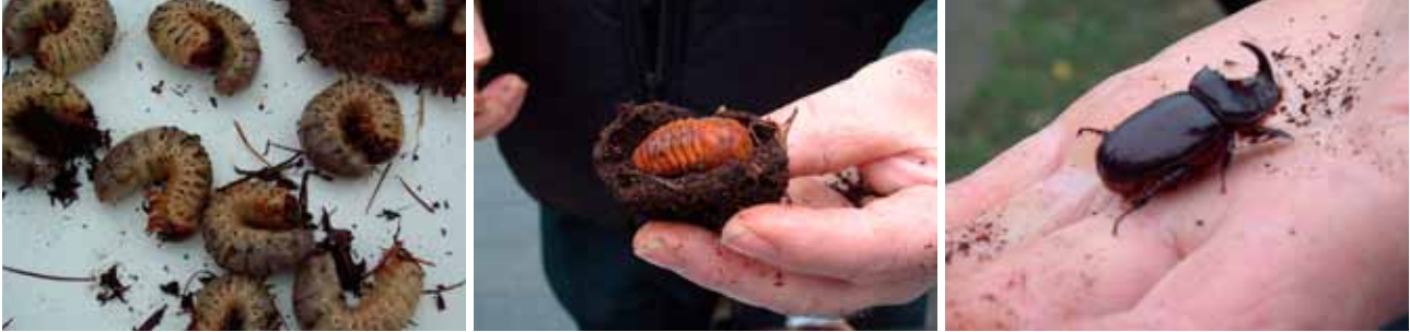
Verskillende ontwikkelingsstadia van de neushoornkever