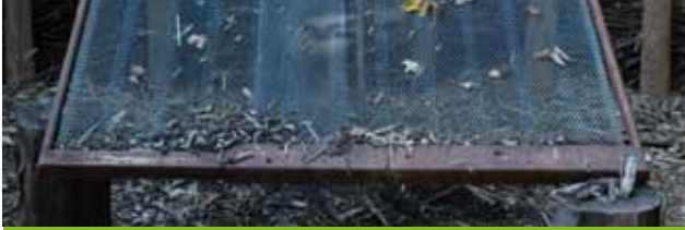
Een vering van een bed: ideaal om compost te zeven