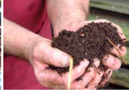
Een handvol rijpe compost

In een groenregio organiseert de IGv, naast inzameling op het recyclagepark, ook ophaling van tuinafval aan huis. Samen met het groenafval van de eigen groendienst wordt dit afgevoerd naar een groencompostering.