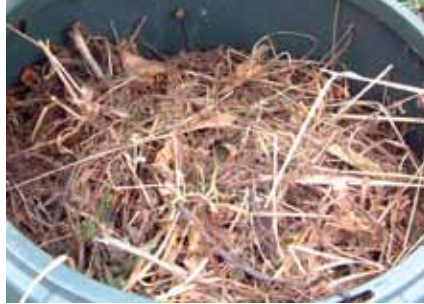
Een voorbeeld van 'bruin' materiaal