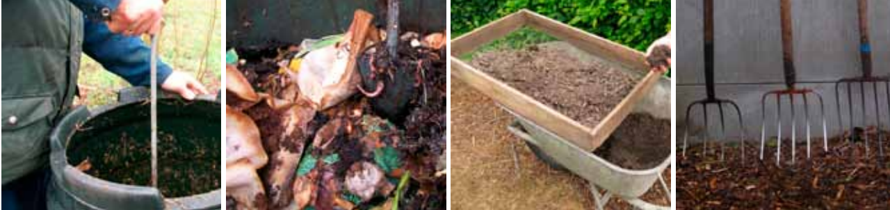
Enkele hulpmiddelen: beluchtingstok, zeef en riek