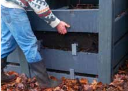
Compostbakken met een uitneembare voorzijde vergemakkelijken het omzetten