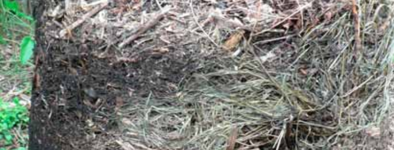
Wat als het compostierend materiaal te droog is?