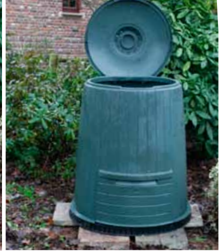
Het plaatsen van het compostvat:: eerst de tegels, dan de bodemplaat, vervolgens de romp.

timeters van de bodem verwijderd blijft. U hoeft niet te vrezen dat de afbraakorganismen niet in het vat kunnen komen. Ze klimmen zonder problemen langs de stenen naar boven, door de gaatjes van de bodemplaat. Wanneer u het vat niet ondersteunt met stenen, dan zult u na een paar maanden vaststellen dat het vat in de bodem zakt of scheefzakt (en soms zelfs breekt) en dat de beluchtingsgaten verstoppen. Het composteringsproces is dan gedoemd te mislukken wegens gebrek aan lucht. Door de bodemgaten kan overigens het overtollige vocht ook wegsijpelen, terwijl de nuttige bodemorganismen toch in het vat kunnen komen.