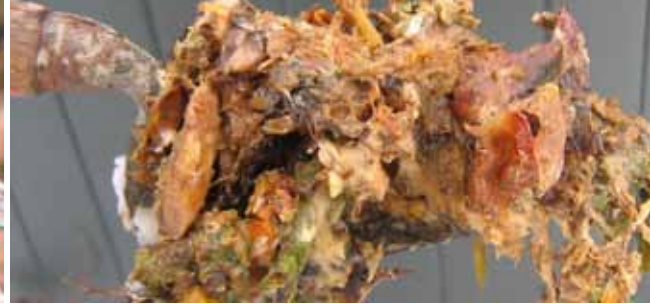
Wat te doen bij ongedierte of geurhinder?

zoals in een bos echte opruimers die hun steentje bijdragen tot de compostering. Ze zoeken meestal de droogste plaats op in de compost. Vaak is dat de verteerde compost. Zodra u die geoogst hebt en daarmee het nest definitief vernietigd hebt, is het probleem opgelost.