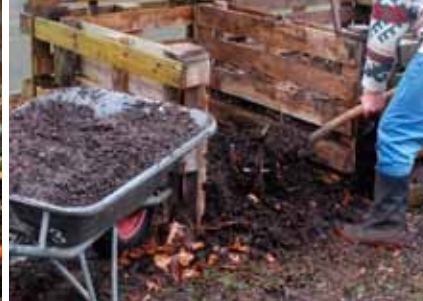
Compost oogsten uit de derde compostbak

rige keer: voorkant bak openen, materiaal loskrabben, en alles in de volgende bak kieperen. In bak 3 zullen eerder schimmels aan het werk zijn dan bacteriën, en is er geen temperatuurstijging meer die vocht doet verdampen. De vochttoestand optimaliseren is niet strikt noodzakelijk; het eindproduct hebben we immers liever droog en kruimelig.